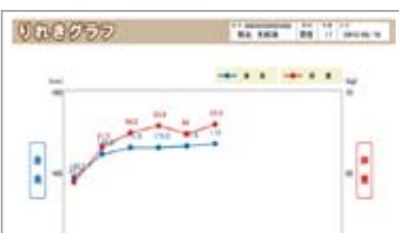
<りれきグラフ印刷例>