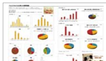
<統計の作成例> ※Excelを使用

診断結果をエクセルなどで再利用可能なCSV形式で保存できます。集団の食事調査統計等をCSVデータを元にエクセルで作成できます。