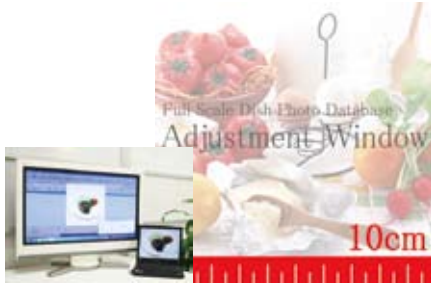
アジャスト機能で多様なディスプレイに対応