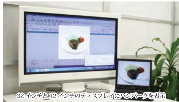
32インチと12インチのディスプレイにハンバーグを表示

料理写真は 1400 ピクセルの 高画質 JPEG 形式で収録しました。 料理写真を保存して 再利用することも可能です!