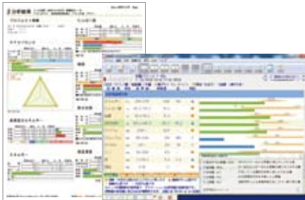
食事調査結果をアセスメント