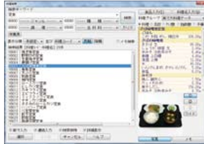
キーワード、分類を検索条件に検索